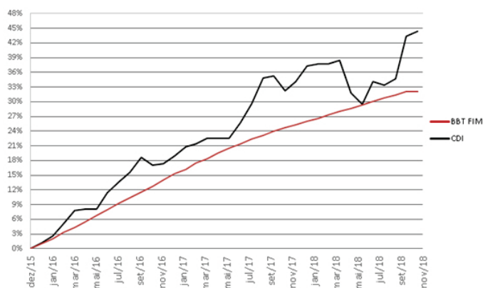
BBT FIM - 36 Meses